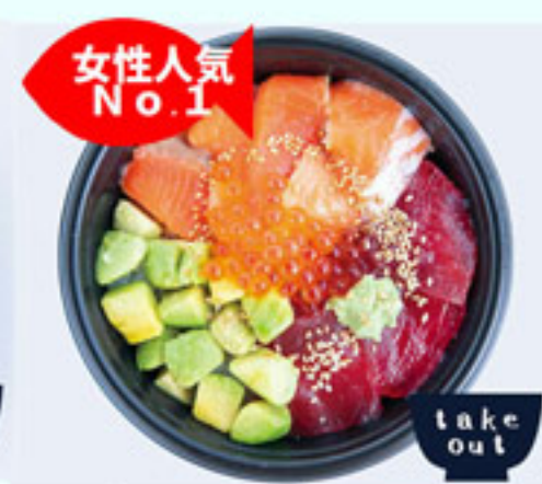
まぐろサーモン アボガ丼 1180円 税込 アレルギー：小麦・さけ いくら・ごま・大豆