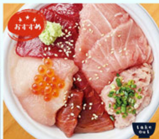
トロとろとろ丼 1280円 税込 アレルギー：小麦・いくら 大豆・ごま