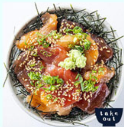
ワンコイン まぐろユッケ丼 500円 税込 アレルギー：小麦、胡麻 大豆