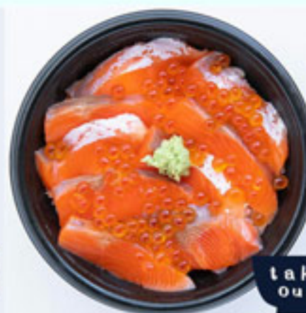
サーモン いくら丼 1180円 税込 アレルギー：小麦・さけ いくら・大豆