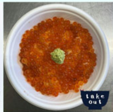
いくらたつぷり 丼ぶり 2980円 税込 アレルギー：小麦・いくら 大豆