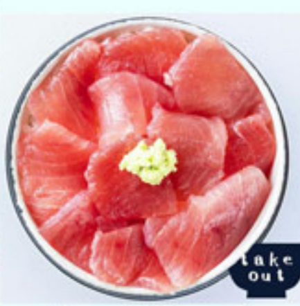
キハダまぐろ 赤身丼 880円 税込 アレルギー：小麦・大豆