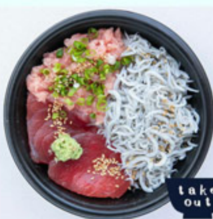
おつきいさかなと ちっさいさかな丼 880円 税込 アレルギー：胡麻、大豆 ※本製品で使用している しらすはえび、かに、いかが 混ぜる漁法で採取しています。