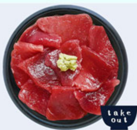
南まぐろ 赤身丼 1080円 税込 アレルギー：小麦・大豆